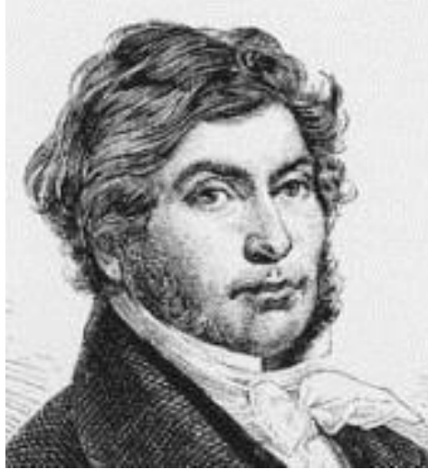
Jean-François Champollion - rozlúštil hieroglyfy